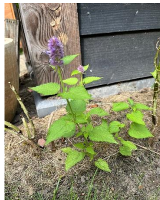
Van zaailing van Aukelien naar een bloeiende droplant! Helena